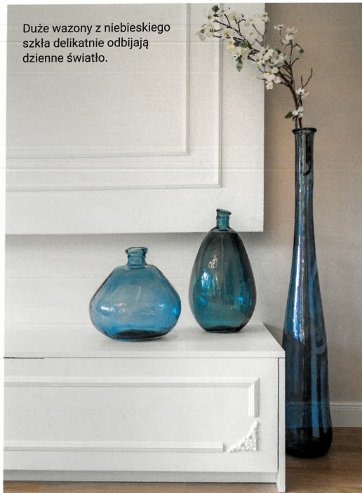
Duże wazony z niebieskiego szkła delikatnie odbijają dzienne światło.