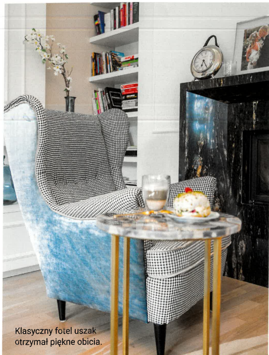
Klasyczny fotel uszak otrzymał piękne obicia.