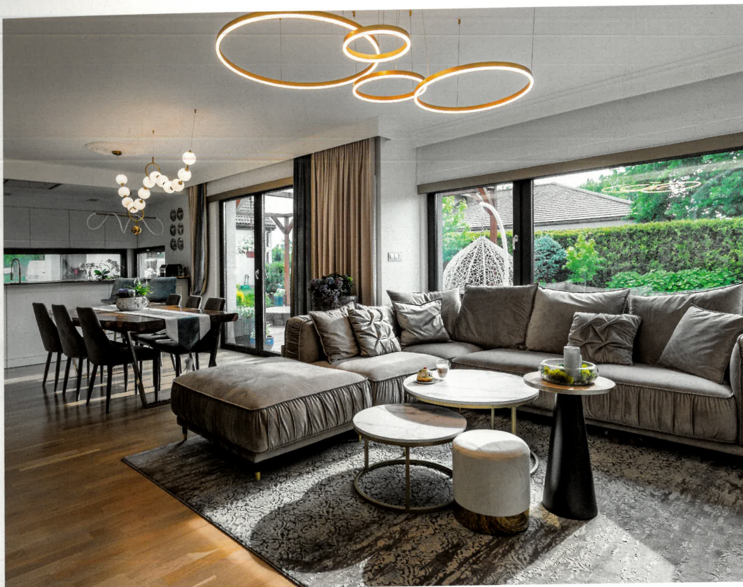
Duża przestrzeń dzienna na parterze tego domu o powierzchni 220 metrów kwadratowych nie narzuca się mieszkańcom i bardzo dyskretnie sugeruje konkretne strefy poprzez ciekawie zamontowane oświetlenie.

Z adanie było intrygujące – całkowite przeprojektowanie domu z „drugiej ręki”, który został wybudowany około dziesięciu lat temu w Gliwicach w stylu minimalistyczno-skandynawskim. Nowi właściciele, czyli para z trójką dzieci, pragnęli czegoś całkowicie innego; co więcej – remont miał być naprawdę kapitalny oraz pod klucz. Tak, by państwo domu nie musieli przejmować się niczym. Projekt swojego wymarzonego miejsca na świecie powierzyli pracowni wnętrz Minterior, wiedzieli bowiem, że to studio jako zespół projektantów, architektów i grafików ma ogromne