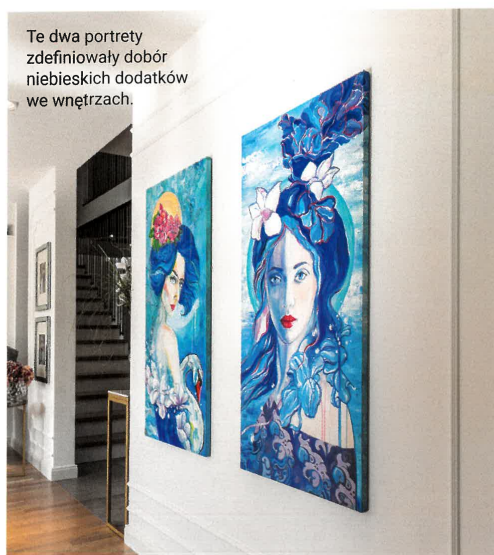
Te dwa portrety zdefiniowały dobór niebieskich dodatków we wnętrzach.