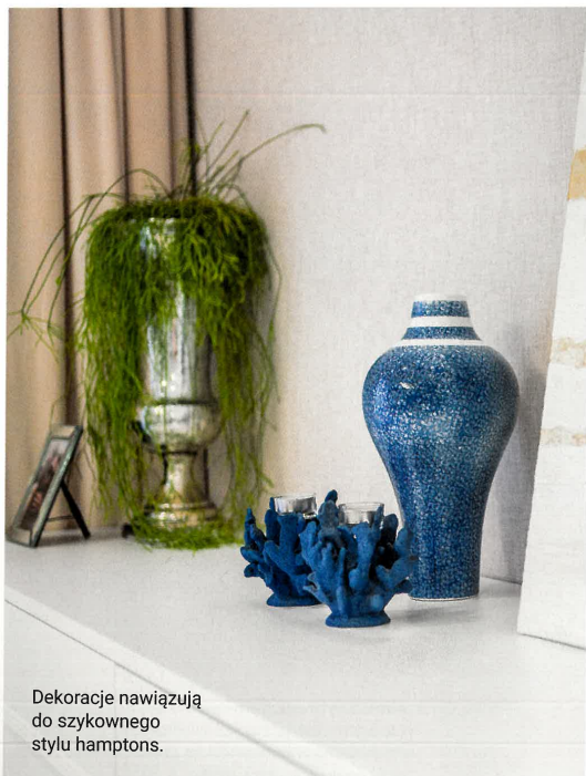
Dekoracje nawiązują do sztywnego stylu hamptons.