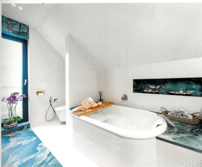
Łazienka państwa domu jest prawdziwym salonem kąpielowym, w którym można zaznać wielkiego wytchnienia w otoczeniu czystej bieli i onyksowych błękitów.