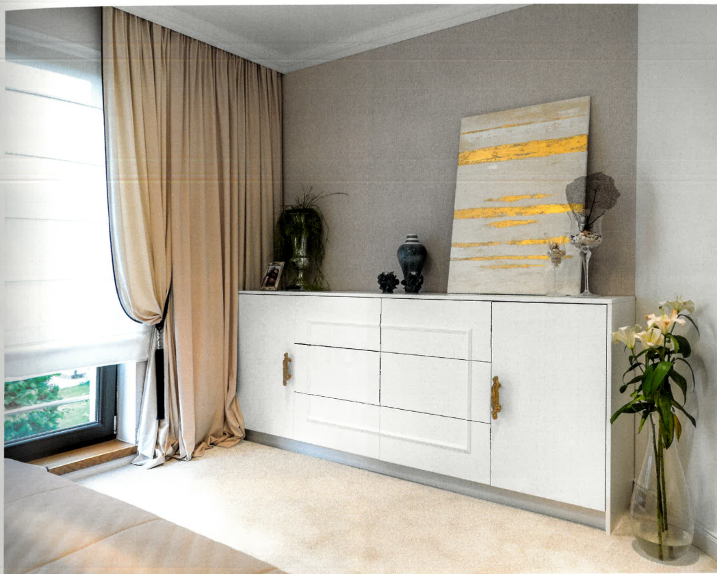
Komoda w sypialni została ozdobiona biżuteryjnymi uchwytami marki Pap Deco. Tę wyrafinowaną dekorację dostrzeże tylko wprawne oko.